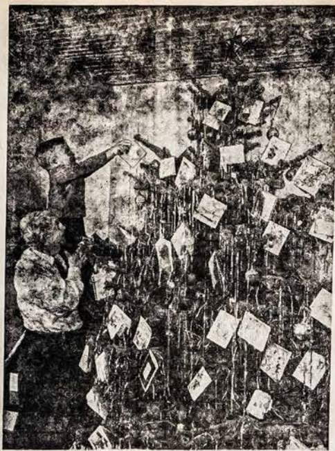
NAUJAS BUDAS PAPUOSTI EGLAITĖ Čia naujas budas kaip parodyti savo Kalėdų pasveikinimo korteles. Parodykite medį su Kalėdų atvirutėmis, kurios priduo da daug spalvos ir blizgėjimo prie kitų žibutų.

Žmogus ne tik pasaulinių įvykių žiurovas, bet ir veikėjas, kurėjas. Belieka apsispręsti ir tarti lemiamą žodį.