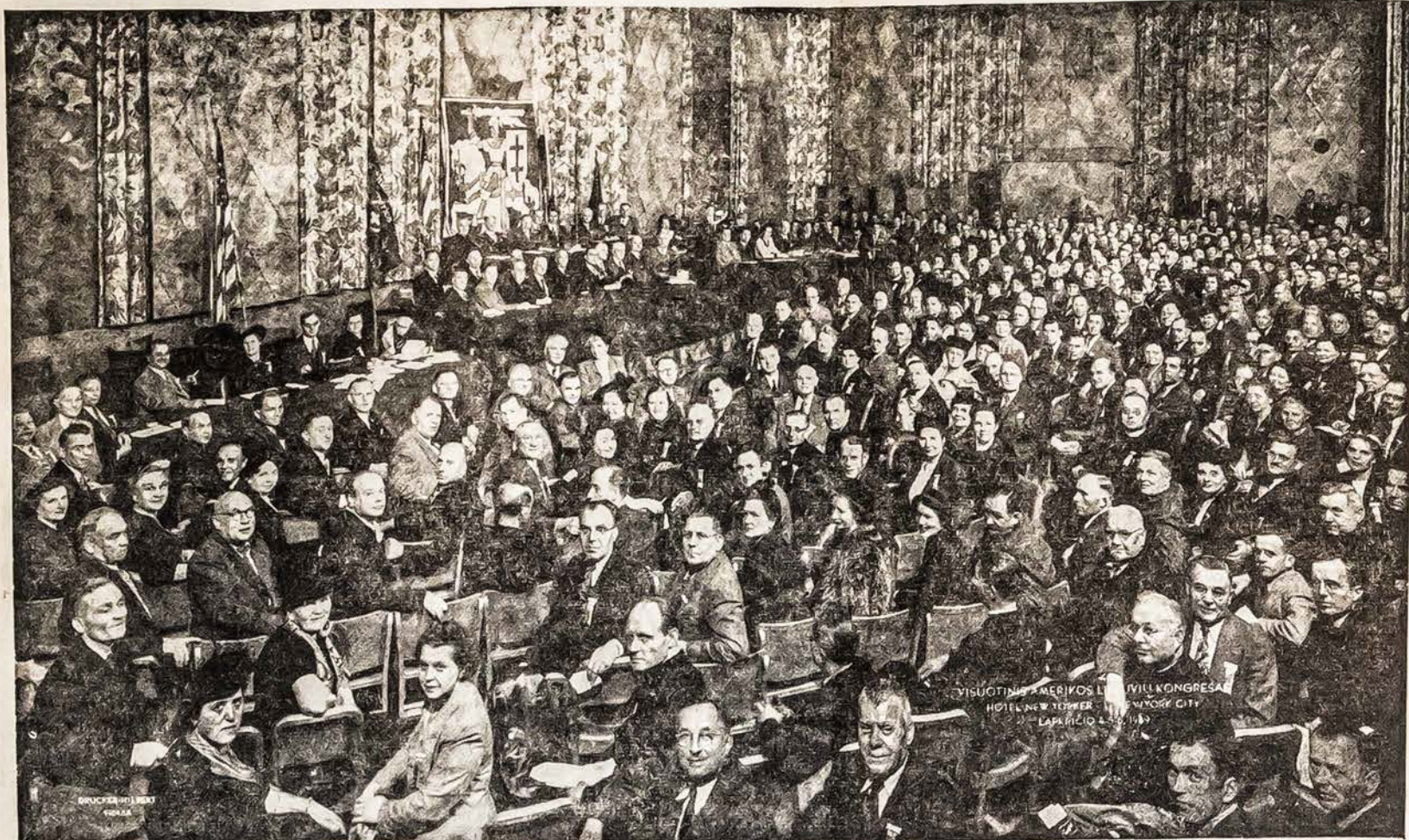
AMERIKOS LIETUVIŲ KONGRESO PIRMOJI DIENA, 1949. Lapkr. 4. Atstovų Dalis