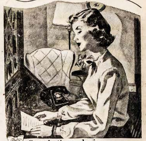
Gera būti mandagiui

Tos pačios telefono linijos vartotojai kaimynai greit išpildo mandagų prašymus užleisti liniją skubiam reikalui... Pastaliant telefono linijos laiku visiems mandagiam yra visiems naudinga... ir bendrai vartojamos linijos patarnavimas tampa visiems sklandus.