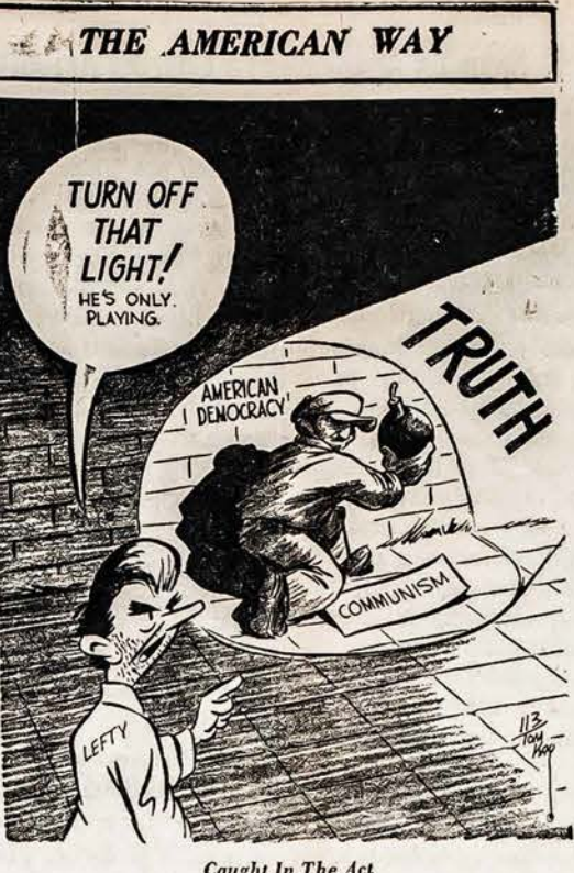
Caught In The Act

LIETUVIAI! SKAITYKITE IR PLATINKITE AMERIKOS LIETUVIŲ