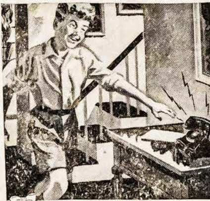
Mandagu būti skubiam

Kuomet prisieina daryti visa eilė šaukimų labai gera ir graži atsiminti ir kitus vartotojus tą pačią telefono liniją ir padaryti mažas pertraukas tarp šaukimų. Tas duos progos ir jūsų kaimynams pasinaudoti jų dalimi linijos patarnavimo.