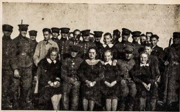
Grupelė moksleivių su kariais nusifotografavom Marijampolės stotyje 1940 metais, kai padėjom kariam pakrauti į traukinį jų daiktus. Čia kariam jau nuplėšyti ženklai. Dešinėje, su šautuvu, stovi lietuvis politrukas.

Amerikos Lietuvis - 14 Vernon St. - Worcester, Mass.