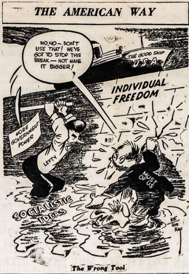
The Wrong Tool

Q—My brother does not want to stay in a Veterans Administration hospital and says he will leave. If he leaves the hospital against medical advice, will such actions affect his compensation? A—No. However, the hospital report covering the period he did remain there may be reviewed by a VA rating board to determine whether his disability warrants continuation of his award or a change in the award.