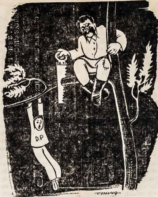
Broliai ir sesės, skubiai kvieskite tremtinius! Rašykite tuojau darbo ir buto garantijas. Garantijų formas kiekvienu pareikalavimu prisiunčia — United Lithuanian Relief Fund Of America, Inc. 105 Grand Street, Brooklyn 11, New York.

Kas leido savo sunų ar dukrą į lietuviškąją pradžios ir aukštesniąją mokyklą, tik tas gali su ramia sąžine pasisakyti: "padariau visa, ką galėjau ir kaip privalėjau prisidėti prie lietuviybės išlaikymo savo vaikuose; o kaip toliau bus—tai pareis jau nuo jų pačių atsparumo svetimybėms įtakai tolimesniame gyvenime". Tokie tėvai yra tikri lietuviai. Jie savo sąžinę nu-raminio ir viešai įrodė, jog visais įmanomais budais stengėsi išlaikyti lietuviybę pirmiausia savo vaikuose! Tokių sąmoningų lietuvių pirmą Amerikoj buvo gana