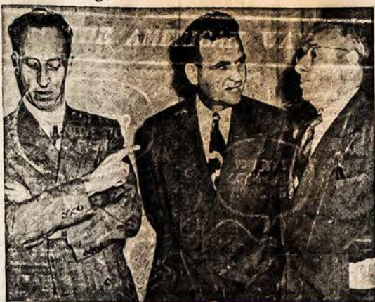
BRIDGES IR PAGELBININKAI TEISME

Amerikos politiški burtininkai leido Staliniui išvoti ir išplėsti iš Austrijos viską - gyvulius, dirbtuves ir mašinas, gelžkelių bėgius, vagonus ir inžinus. Už tokį apilėšimą Austrijos, Amerikos valdžia priverė Austriją užmokėti $150,000,000 Staliniui už gerai atliktą vagonų darbą.