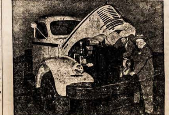
NAUJAS "GOLD CORNET" SUNKVEZIMIS LANSING, MICH. — Šešių cilindrių gasolino sunkve... zimio inžinas, vienas iš galingiausių kiek buvo pastatyta, buvo... perstatytas Reo Motors, Inc. Šis naujas Reo inžinas buvo išdirb... tas dėl sunkaus darbo, greitumo ir sunkių kvoninių vežimui.