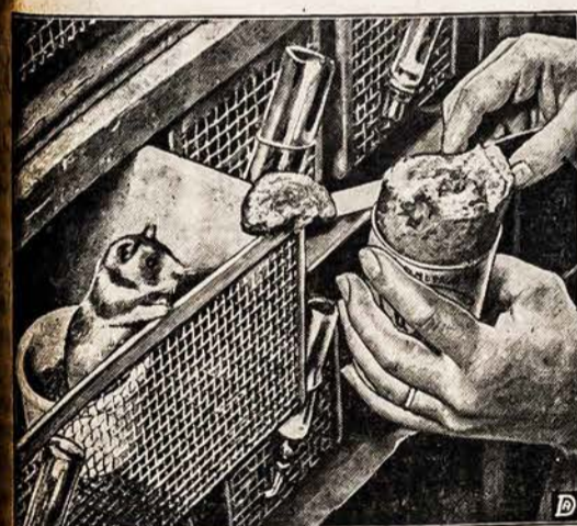
This chipmunk-like animal, anxiously reaching for his dinner of canned dog food, is a Syrian Golden Hamster. He and scores of his relatives are kept to test the effectiveness of various canine rations.