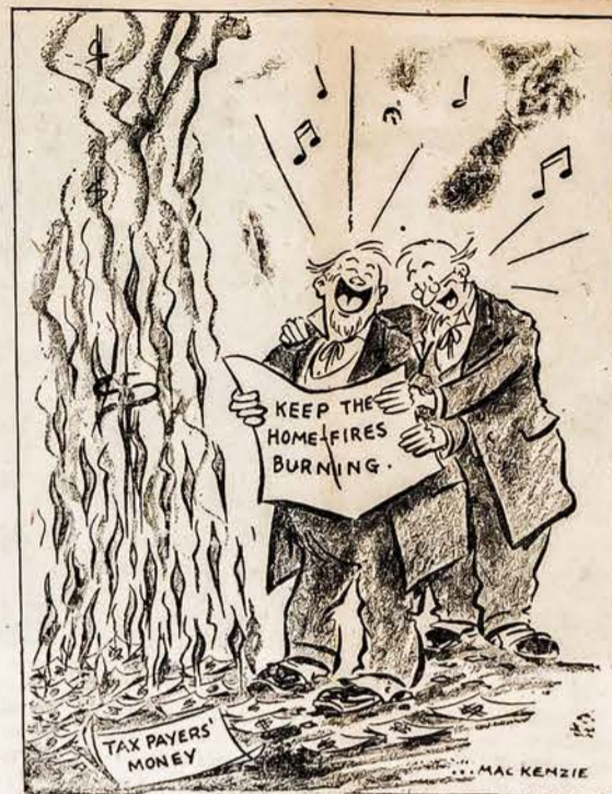
WASHINGTONO TEMOS DAINA

My dear American friends, and my dear Fellow FREEDOM FIGHTERS! America first pro-