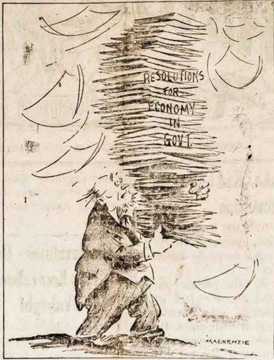
REZOLIUCIJOS VYRIAUSYBĖJE DEL EKONOMIJOS