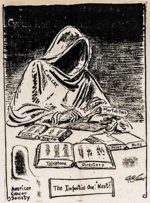
Kuris Sekantis Bus Nuo Vėžio Mirusių Sąraše?

Tokioje nuotaikoje ir ekstaziškoje bebudami nubraukė nevienu nauja ateivė lietuvaite ir nevienu lietuviu savo gailią ašarą beklausydamai kalbų ir diskusijų. Jausdamiesi, kad jie tarsi esą pokarinėje savo tėvynėje Lietuvoje, nes šiame Seime jie rado ne tikai lietuvišką kalbą Seimo dalyvių tarpe, lietuvišką galvosėną, lietuvišką idealą, lietuvišką širdį ir sielą pas kiekvieną Seimo dalyvį. Žodžiu, ateiviai pajautė šio Seimo veiksmus tarsi širdies ekstaziš-