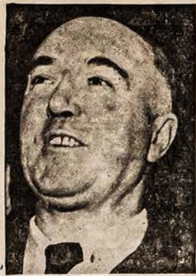
KOMUNISTAS IŠGELBETAS NUO MINIOS

Gerb. dr. Gimbutienė kalbėjo TMD arbatėlėje labai trumpai, bet jos pareiškimai, kaip taurios lietuvaiteš, akademikės, filozofės labai reikšmingi ir neabejoju, kad ateityje mes jį girdėsime lietuvių kolonijose plačiau ir ryškiau pasisakančią mūsų lietuviškais ir kultūriškais reikalais ir mūsų tautos ir jos kultūros rezistencijos ir ekzistencijos įvairiais problemiškais ir reališkais bei aktuališkais klausimais. Aš neabejoju, kad mes matysime ją neužligo lankančią Harvardo universitetą ir jos ateities veiklą, darbus ir paskaitas ne tikitai lietuvių, bet