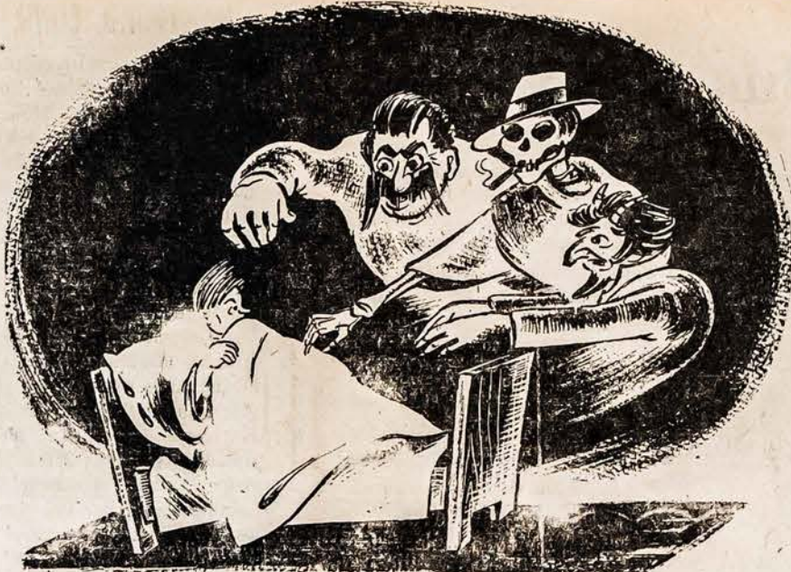
Amerikos lietuviai, Gelbėkite! Musų tautos kankintojai tiesia nagus į mane, vargšą tremtinį. Darbo ir buto garantijas, o taip pat aukas tremtiniam sušelpiti siūskite: United Lithuanian Relief Fund of America, Inc., 105 Grand St., Brooklyn 11, N. Y.

Washingtono valdžia jau daug ką musų gyvenime tvarko. Ji prižiūri bankus, geležinkelius, sanitarines taisykles maisto gamyboje, darbininkų sveikatą ir ūkininkų gaunamas kainas. Jau įvesta pensijos senatvėje ir parama bedarbiams. Nauja programa siekia pa- ūdaryti augštus mokslus pri- ūeinamais visam jaunimui. Be to, norima padaryti pri-