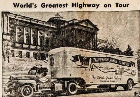
HARRISBURG, PA.—"Stay-at-homes" who have never had the opportunity to drive over the famed Pennsylvania Turnpike will get a chance to see it in miniature as the State of Pennsylvania sends a huge relief map of the highway on a tour of the states. The great express way, between Harrisburg and Pittsburgh, through the picturesque heart of historic Pennsylvania, is one of the world's finest examples of modern highway construction. The relief map will be transported on the first leg of its tour through the east in a Fruehauf furniture van whose interior is specially decorated for the exhibit. The state capitol here is in the background.