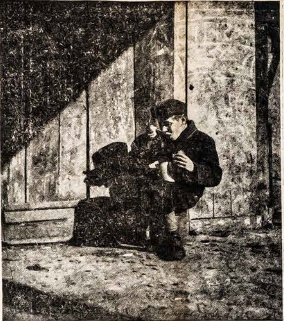
Sušelpkite vaikučius tremtyje. Jų yra 15,000. Jų likimas Jusų rankose. 3500 rinkėjų visoje Amerikoje renka jiems aukas. Paremkite juos!

Anglijoj daug kas patyria, tai ko nestikėjo. Argi tokia nuo amžių džentelmeniška tauta turėtų ir blogų šešėlių? Praužęs II pasaulinis karas paliko savo pėdsakus. Daug nėra namų, žmonės tenkinasi barakuose, maisto maža, pinigų nėra. Darbininkas čia gimei, juo ir busi, niekada neliksi savarankus bene privačiai išeisi. Piniogas čia viską gali, o jo tiek maža: už 48 val. darbo vos 4,5 svaro (už 96 val 9 svarai, kaip buvau rašęs). Todėl dirbi žmogus per dienas, prakaituoji, gauni užmokestį, o žiurėk, kaip greitai jis šilingais penais išsisklaido. Bet tremtiniui lietuviui ir to užtenka. Nes