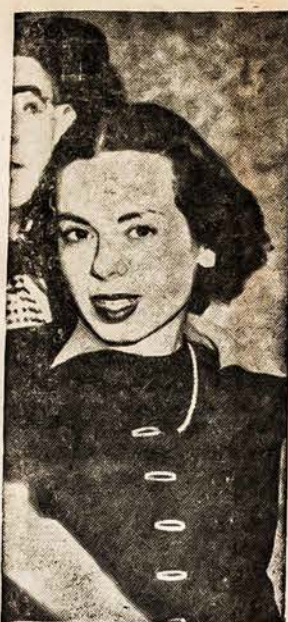
ARESTUOTA KAIPO SNIPE

Kitokią nuomonę radau tarpe Baltijos kraštų žmonių, lietuvių, latvių, švedų ir danų; jie Ameriką geriau pažįsta, arba, įsivaizduoja; jie žiūri į amerikiečių kultūrą, humaniška žmogų, o ne robotą, žmogų be sielos ir širdies tarsi puslankinį. Patyręs europiečių nuomonę aš prisiminiau posakį: „Iš toliau žiūrinti žmonės geriau mato“. Gal šiame posakyje yra teisybė. Pabaltiečiai reališkiau