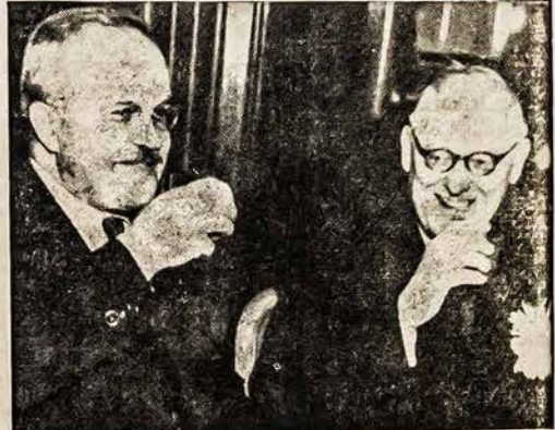
MOLOTOVAS PRAŠALINTAS, VISINSKIS JO VIETOJ LONDON, ENGLAND.—Maskvos radio pranešė, kad so... vietų užsienio ministeris V. M. Molotov, kairėje buvo paliuosotas... iš savo pareigų. Andrei Y. Višinsky (dešinėje) sovietų delegatas... į Suvienytas Tantas buvo paskirtas į Molotovo vietą. Paveiks... las buvo nutrauktas 1946 metais važiuojant laivu Queen Eliza... beth į New Yorką dalyvauti Suv. Tautų suvažiavime.

Kiekvienas stengiasi... maisto iš kur nors pasipil... dyti. Tėvai nutraukia kąs... nuo savęs, geriau pavalgy... dinti savo vaikučius. Gelbė... dami vaikus, patys tėvai... taip nusilpsta, kad kai atei... na eilė emigruoti, betikri... nant sveikatą, atrandama... džiova ar kita liga. Tokiai... šeimai emigruoti kelias... užkirstas! Kokia išeitis!... Likti pusbadžiauti šaltoje... stovykloje, kur sveikata ne... pagerės, ar vykti į sanato... riją ir palikti vaikus vienus... svetimų globai? O tokių... šeimų yra nemažai.