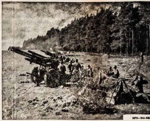
These U. S. Army recruits find that field problems can be fun as well as interesting work. They learn the techniques of weapon firing and the importance of coordination and cooperation with others. The Army today offers many opportunities for education, advancement, and an excellent career.

makes no change in our educational system, but merely enables worthy students without financial means to get higher education at no cost to the government. Why isn't that a worthwhile end?"