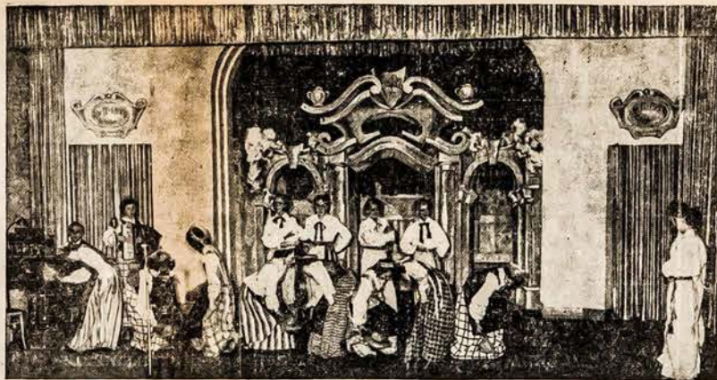
SV. KAZIMIERO AKADEMIJOS STUDENTĖS IŠPILDO TAUTISKĄ ŠOKĮ "KEPURINĖ" PER MARGUČIO BENKIETĄ