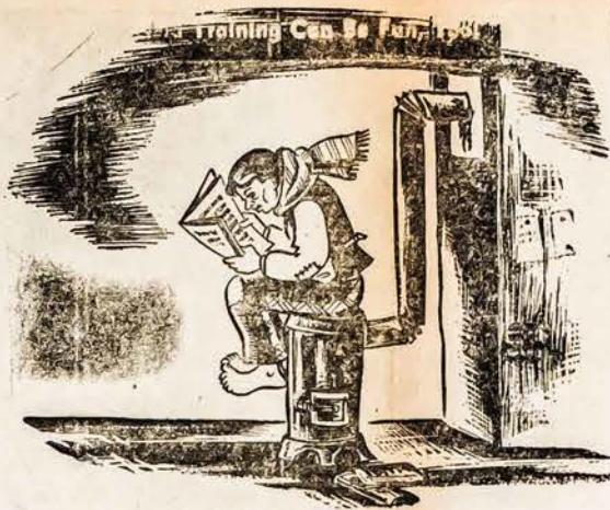
Salta, ayku, neramu, Kojos basos, keliai kiauri, Oi, gyventi mums sunku. Pagelbėkite tremtiniams. Aukus siųskite: United Lithuanian Relief Fund of America, Inc., 105 Grand St., Brooklyn 11, N. Y.