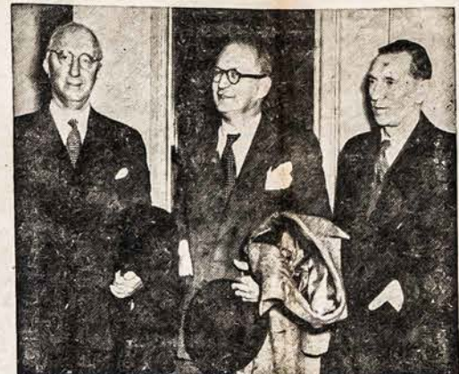
NORVEGIJOS UŽSienio MINISTERIS SUV. VALSTYJOSE NEW YORK. — Norvegijos Užsienio Ministeris Halvard M. Lange vadovauja atstovybei tartis del siulomo Šiaurinės Atlantikos Apsaugos Pakto. Jis čia stovi vidury su W. Muntle De Morgenstierne, Norvegijos Ambasadorium SUV. Valstijom (kairėje) ir Oscar Torp, darbo vadu Norvegijos Parlamente. Delegacija išvyko iš Oslo, tuojaus po Sovietų Rusijos pašaukimo Norvegijos pasirašyti nepuolimo sutartį su Kremlinu.

Šią savaitę Karibų juroje Amerikos karo laivynas daro "atominius manevrus". Karo laivai bus "atakuojami" atominėmis bombomis ir radio vilnimis vadovau-