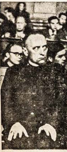
KARDINOLAS NUTEISTAS Budapest Vengrija. — Liaudies Teismas nuteisė Joseph Kardinolą Mindszentį kalėjimu visam gyvenimui. Kardinolas atrodo labai nuvargintas. Ankščiau jis buvo pasakęs, kad jei kada prisipažintų prieš išdavystės, tai būtų del kuno silpnybės.