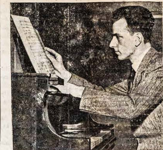
TOSCANINI Protege — Jaunas italų dirigentas Guido Cantelli, kuris bus svečias diriguoti NBC Simphoniniam orkestrui pradedant šeštadienio sausio 15 d., buvo atrastas Arturo Toscanini Italijoje pereiną vasarą. Maestro buvo taip sužavėtas Cantelli'o talentu ir jį pakvietė kaip svečią diriguoti NBC Simphoniniam Orkestrui.