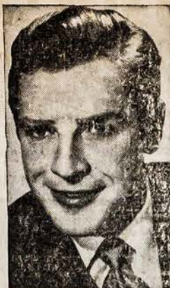
RICHARD BASEHART, jaunasis filmų aktorius, kurį kritikai gyrė kaip gabų artistą Broadway, New Yorke, buvo svečias NBC Hollywood, Žvaigždės teatre, Kalėdų Naktį.