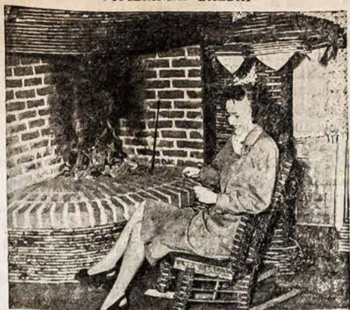
PIGEON COVE, MASS. — Šioji graži mergina sėdi popie- riniamė name ant popierinės kedės, skaito prie popierinės liam- pos, šildosi prie popierinio krosnio. Visi baldai padaryti iš senų laikraščių kietai suspaustų ir apdarytų su Waterslę Laku, kas apsaugoja popierius nuo vandens ir oro. Tai didelė pagelba, ka- da trunksta namų.

Fondo vadais užmezgimui glaudžių santykių ir bendra- darbiavimo kultūrinėje sri- tyje. Tikimės, kad tikslo bus pasiekta ir, kad lietuviai kultūrininkai su s i j u n g e bendram kultūriniam veiki- me labai daug naudos pa- darysį mūsų visuomenei ir mūsų tautos naudai ir gar- bei, subendrinsį vakarų Europos ir Amerikos lietu- vius kultūrininkus ir jų veiklą. Kad tikslo pasiekus ir sėkmingai išvysčius mu- suoširdžiai prašau visus TMD narius pasiūvesti or- ganizaciniam darbui, prašau kiekvieną narį ir narę pri- rašyti nors po vieną narį prie TMD 1949 metais ir padvigubinti TMD narių skaičių ir TMD veiklos iš- gales 1949 metais.