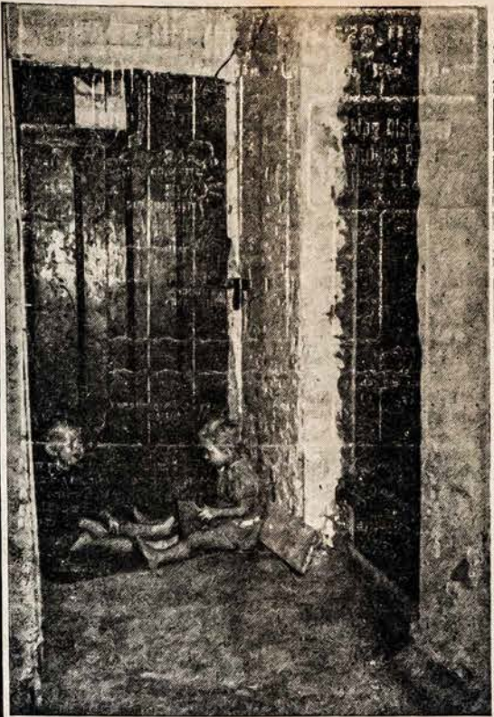
Sušalę ir alkani tremtinių vaikai laukia ateinant Kalėdų senelio. Šiandien pat ištieskime pagalbos ranką, kad ir mūsų lietuviškai Europoje pajustų šv. Kalėdų džiaugsmą. Siųskite aukas: United Lithuanian Relief Fund of America, Inc., 105 Grand St., Brooklyn 11, N. Y.

Siomis dienomis BALF'as išsiuntė į Europą lietuviams tremtiniam laivą S/S American Shipper šią siuntą: a) Įvairių dėvėtu rūbų 367 maišus, bendro svorio 35,542 lbs., vertės $34,868.00. b) Apavo, rūbų ir kitokių smulkesnių reikmenų 50 dėžių, bendro svorio 10,542 lbs. vertės $5,999.10. Viso $40,807.10. Jei išskirstyti kiekvienam tremtiniui tai išeitų vos po 1 svarą kiekvienam, vertės po 80 centų. Kviečiame gerasirdžius tautiečius aukoti ir toliau ir visokeriopa remti BALF'ą, kad