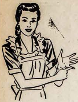
Smarkios kepėjos žino, kad Gasas Turi Viską!

Vyt. Grauzinis, Baltic DP Camp, (14a) Fellbach b. Stuttgart, USA zone, Germany