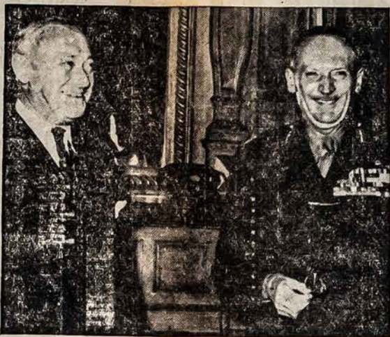
PENKIŲ TAUTŲ MILITARISKAS VADAS

KALĖDOS Amerikoje Kalėdų švenčių proga susirenka giminės pas gimines, pažįstami pas pažįstamus ir t.t., gardžiai užkandžiauja, skaniai nugerdinėja ir taip sutinkama ir praleidžiama šventė. Tremtyje lietuviai irgi žino, kad ateina Kalėdos ir kitos šventės, dėja ką jie ant stalo pasidės, kuo pavaisins atsilankusius į švečius? Mes Amerikos lietuviai, turime nemažai tremtyje giminių ir šiaip pažįstamų, bet visi lietuviai juk mūsų giminės, o mes jų. Mes siunčiame pakietus, bet mes nepamirštame ir specialių Kalėdinių pakietų tremtiniams. Beliko jau tik kelios savaitės. Kol Kalėdų pakietai iš Amerikos nukeliauja, praėina 4 ar 6 savaitės iki tremtinių juos gauna, todėl, jau pats laikas Kalėdiniai pakietai išsiųst, kad Kalėdos būtų Kalėdomis ir tremtiniams. Yra daug tukstančių tremtyje, kurie neturi Amerikoje jokio pažįstamo, nėra dar gavę iš niekur nei vieno pakieto, gavę jų pakietus, jie pasidalins po trupinėlį ir Kalėdų momente jie apie jus prisimins. Kas neįgalia pats paruošti pakieto, galima pasiųst pinigų kad ir į M. Anušką, 560 Grand St., Brooklyn, N.Y., kurs persiunčia pakietus. Su juo laiškais galėsite susitarti, koks pakietas geriausiai kombinuoti ir kiek kainuos. Turėkite gerų norų, o pagelbėt pasiųst pakietą, atsiras talkininkų. Padarykite žygius, kad ir tremtiniai žinotų, kad tokia šventė, kaip Kalėdos yra. J. V. Valickas