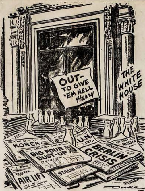
KAS NORS TUREJO SUSTABDYTI LAIKRAŠČIUS!

Slovėnai—sako p. V. G.—palyginus su lietuviais proporcionališkai ne tiek skaitlingi