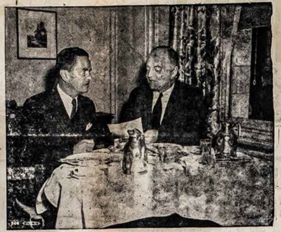
Buvęs Minnesota valstijos gubernatorius Harold E. Stassen su Massachusetts gubernatorium Robert F. Bradford valgo pusryčius Copley Plaza viešbuty, Bostone, laike Stasseno vienos dienos atsilankymo pasakyti prakalbą Mass. valst. republikonams, idant jie remtų Dewey - Warren - Bradford tikietą.