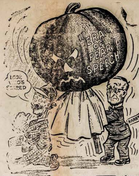
KURIS KURI GAZDINA?