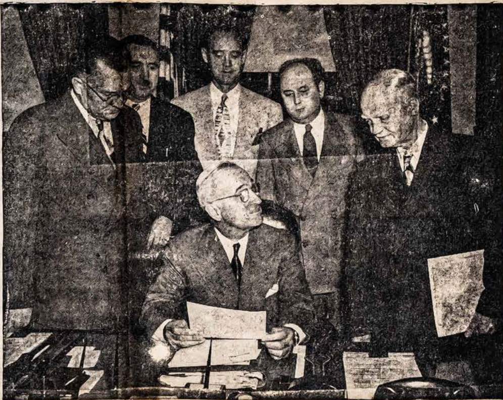
Š. m. rugsėjo mėn 16 d. Jungt. Amerikos Valstijų prezidentas Harry S. Trumanas priėmė Baltuosiuose Rumuose Washingtono Amerikos Lietuvių Tarybos delegaciją, kuri įteikė prezidentui memorandumą Lietuvos reikalais.

Už demonstravimą prieš bolševizmą, rusai Berlyne nuteisė penkis jaunos vokiečiųkus po 25 metus kalėjimo.