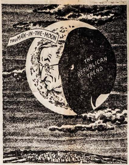
TRUMANAS MĖNULIO UŽTEMIME!