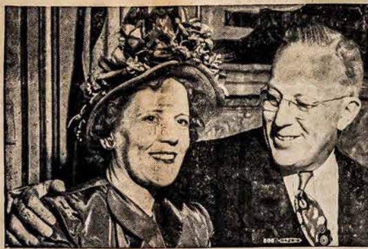
Fotografijoje matome gubernatorių Earl Warren ir jojo žmona, kuriedu lankysis Mass. Valstijoje rugsėjo 27-tą ir 28-tą. (Pittsfielde, Springfielde 27-tą; Lowelly ir Worcesterį rugs. 28).