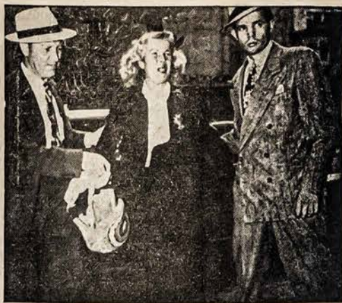
ASIES SALLY WASHINGTONE Mildred Gillars, pirmiau iš Portland, Maine, buvo FBI agentų sutikta prie Armijos lėktuvo, kuriame ją atvežė iš Vokietijos. Ji kaltinama už radio transliavimus del nacių.

Todel nerimas Švedijoje, Norvegijoje didėja, gresia šių kraštų sugriovimo pavojus. Pietuose — Italijoje, Grekijoje pavojus ne tiek žmonėms baus kaip šaurės kraštuose, nes pietų kraštai sugriauti, žmonės prie karo kovų prapatę. Turkija bus tokios svarbos objektu kaip Persija (Iranas) ir Švedija rusų militarinės strategos. Tatai šiuo strategos atžvilgiu dabar daug kalbama vakarų Europoje. Kritikai politinių ir militarinių sferų teigia, kad jei Maskva pulyt visus šiuos kraštus kartu, kai jie žygiuos į Vokietiją, tuomet būtų sąlygos šias bazes amerikiečiams ir anglams išnaudoti ir išlaikyti, bet jeigu Maskva pulsianti tikta Vokietiją, o vėliau Švediją ir Norvegiją, Iraną ir