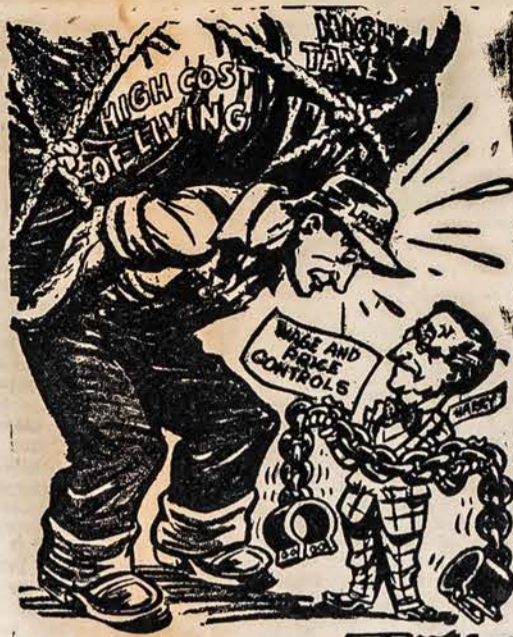
O, KOKIA DARBO DIENA SVENTĖ! Aukšta Pragyvenimo Naštą! Didelės Taksos—Tik Retežiai

žmonių stoka. SLA sei- mas, išrinkęs savo organui... O ir esami redaktoriai... (Text continues with news and editorials)