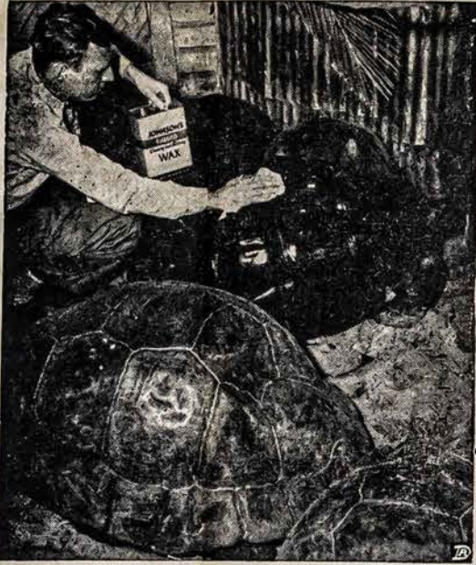
PIRMAS SVIETIMAS Į 500 METŲ St. Augustine, Florida. — Šio 500 metų vėžlio skydas net blizga, kada pirmą kartą buvo nušveistas su vašku. Šie vėžliai gyvena Galapagos saloje, skaitomi seniausi pasauly ir nemėgsta vandens.