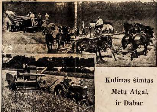
Kulimas šimtas Metų Atgal, ir Dabar

Tatai geistina, kad visi TMD skyrių vadai ir nariai stotų į talką savo draugijos vadams ir per pastarus du metus, ligi sekančio Seimo, kuris įvyks Baltimorėje, nuosirdžiai bendradarbiautų. Jeigu TMD centro valdybos ir skyrių valdybų nariai vieningai ir nuosirdžiai pasišvėsia TMD reikalams, reikia manyti, kad sekamam TMD Seime galėsime