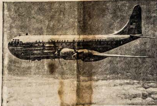
NAUJAS CLIPPER AMERICA