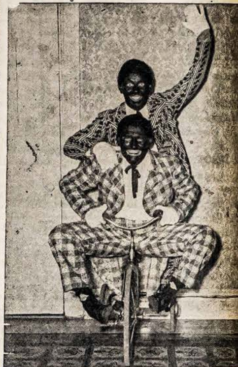
"Hi-ya folks, see you at the picnic Sunday, August 1st, at Vose's Pond, Maynard. We are the two Wicked Comical Canadians.

also $300 I. J. FOX FUR COAT and FUR HAT to and Other Wonderful Chance Prizes