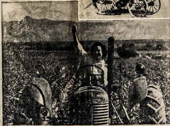
MILWAUKEE — Viršų yra pirmasis gasolinu varomas traktorius, pastatytas J. I. Case kompanijos 1892 metais. Iš šios menkos pradžios, išsivystė šios dienos moderniški traktoriai. Wisconsino šimtmečio parodoje vadinamoj "Mašinų Marše", buvo rodomos Case išdirbystės senovinės ir moderniškos mašinos.