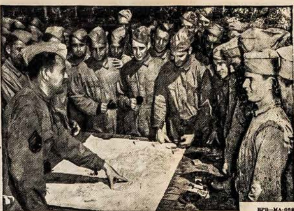
Students at the Armed School, Fort Knox, Ky., learn to orientate themselves with the help of a map and individual compasses as a qualified sergeant instructor imports the know-how of map reading. Currently, there are many openings for qualified men between the ages of 17-35 in the Army Field Forces.