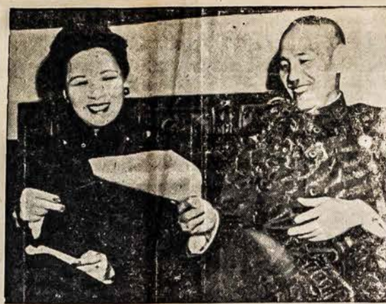
CHIANG-KAI-SHEK KINIJOS PREZIDENTAS

Taip, mūsų tautos žmonių kovų istorija krauju parašyta. Kupina kančių ir beviltišku laikų, bet ji tiek pat kupina garbingų tradicijų ir ryžtingos valios; šios lietuvių budo savybės tebėra dabar širdyse taurių lietuvių nepaisant to kur jie begyventų. Tatai dabarties laikot-