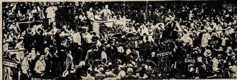
PHILADELPHIJOJ PARTIJŲ SEIMAI

AMERIKOS LIETUVIŲ TAUTININKŲ CENTRO VALDYBA