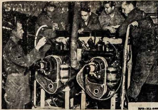
KAS VARO INZINUS?

Subscription: In U.S. $3.00 In Foreign Countries $4.00 Single Copies 4 cents Advertising rates on application