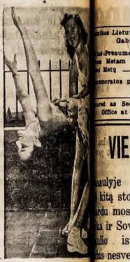
Chicago Medicinos kursančių mankšta at poilsio metu.

(Antanas Jūda, Sav.) 12 Ashmont Ave. Tel. 2-5336 Worcester, Mass.