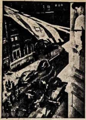
ZYDU VALSTYBĖS VĒLIAVA

Atsiskliausiu jo, pasakyti savo patyrimus apie Čekijos perversmą. Jeigu Amerika, sako jis, nebūtų davusi Stalino agentams pagelbos, Čekoslovakija joku būdu nebūtų patekusi po Stalino kruvina letena. Kuomet prasidėjo atkakli kova ar Čekija turi valdytis pati, ar tapti Stalino teroro vergė, tesa jis, Amerika dėjo visas pastangas, kad Čekija taptų Stalino vergijos auka. Amerika davė už dyką popierio Stalino agentam. O mes, kurie kovojom prieš Stalino teroro valdžios užmačias, negalėjome gauti pirkti popierio nė už pinigus, nes Amerika mums popierio nepardavė. Stalino agentai ant gauto už dyką iš Amerikos popierio piešė slykščiausius paveikslus juodinant Ameriką. O Amerika davė netik popierą Stalino agentam, bet ir maistą už dyką. Kuomet čekai pamatė Amerikos pardsivimą Stalinui, tarp Čekijos liaudies įvyko toks slėgimas, kad žmonės nežinojo ką jie veikė, kur ėjo, net negalėjo nė kalbėtis tarp savęs, kuomet pamatė, kad Amerika iš visų pastangų remia Staliną del sunaikinimo Čekijos tautos. Kuomet Stalino agentai gavo viską už dyką iš Amerikos, tai Stalino agentai juokėsi iš Amerikos kvaulumo. Stalino komisarai visumet pakartotinai sako, "durnas kai amerikonas". Taip kaip Lietuvoje, lietuviai kad sakydavo "durnas, kai prusas". Jo atsiskliausiu, jeigu jau kaltini Ameriką Čekoslovakijos pardavime, argi tai netiesa, kad Masaryk ir Beneš, jusų tautos vadai buvo Stalino bendrakeiviai? Jie buvo bendrakeiviai Stalino ne iš savo noro, jie bu-