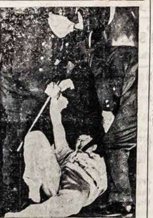
JUDOMŲ PAVEIKSLŲ PIKIETAS