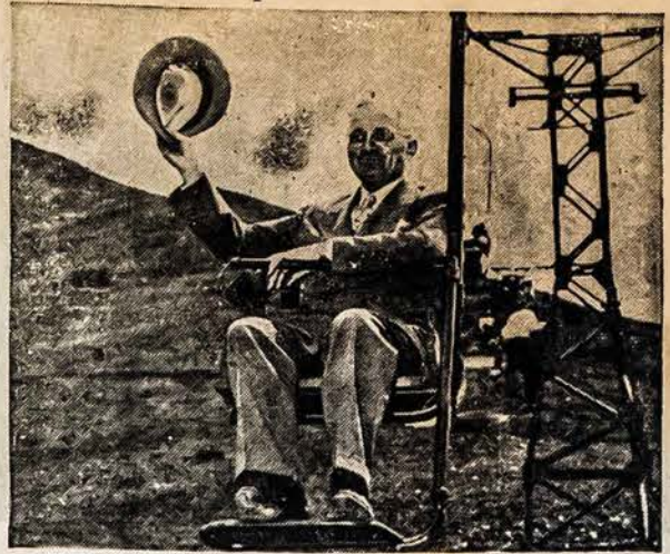
SUN VALLEY, IDAHO — President Truman pictured as he takes time off for a ride on a ski lift to Dollar Mountain here. The chief executive later departed from Sun Valley for Kibbo Falls on his transcontinental trip.

Mr. President, the reason that some preferences, now 40 percent, was given to the people of those countries was this. Those people cannot return home. There is no question about that. If they go back to their native land, the people of East Poland, those of Lithuania, Latvia, and Estonia, they are certain to suffer bodily harm and perhaps death. They were among the first who were seized by the Germans and forced into so-called slave-labor camps. That has already been explained, but it may well be repeated. Why was a dead line of December 22, 1945, fixed? It was fixed for only one reason, Mr. President, and that was that, knowing we could not take all DP's, we