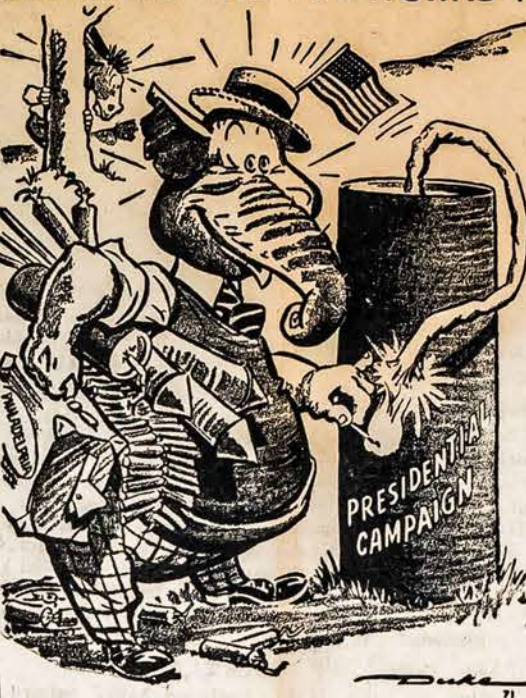
PRADEDA UG NIATRASKIUS!

Pasirinkimas aiškus: arba tikėti, kad lietuviai bus visi išgalabinti ir išdeportuoti, arba kad tragedija jų nepalauž.