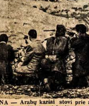
JERUZALĖ, PALESTINA — Arabų kariai stovi prie akmeninės sienos Alyvų Kalneli, netoli Jeruzalės, kovai besitesiant už Jeruzalę.