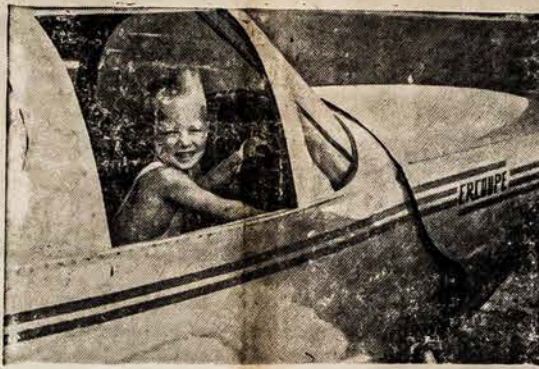
KETURIŲ METŲ BERNIUKAS MĖGSTA SKRAIDYTI

Kongresmonas Emanuel Celler (žydų kilmės) ir jo bičiuliai demokratų partijos reikalauja, kad šis įstatymas būtų pakeistas, yra žiniu, kad oponentai įstatymo deda pastangas per