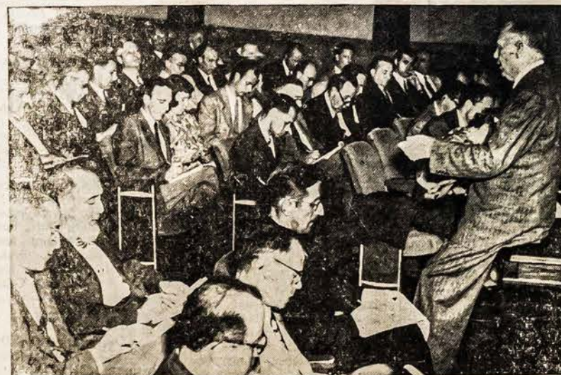
MARSHALL LAIKO ŽINIŲ KONFERENCIJA WASHINGTON, D. C.—Valstybės Sekretorius George C. Marshall kvietė Rusiją užbaigti "Šaltą Karą" per pozityvę akciją, kad subendrinti svarbesnius skirtumus tarpe Suvienyto Valstijų ir Sovietų Rusijos. Kad tuos neaiškumus išaiškinti, Maršalas išleido aplinkraščių, kurį jis skaito Spaudos Konferencijoje. Sakoma, kad Maskva sutiko tartis su Amerika, kad pagerinti santykius tarpe Jungtinių Amerikos Valstijų ir Rusijos.

Lietuviai yra daugiausia pabėgę nuo rusų ir vokiečių priverstiniais darbams išvežti. Nors jų skaičius sumažėjo, bet tebėra 70,000 vargstančių ir bevilčiai laukiančių nežinomo likimo. Visų tautų drauge tremtinių dar yra likusių virš milijono. Lietuviai, latviai ir estų drauge, kurie klasifikuojami kaip baltai, yra apie 230,000.