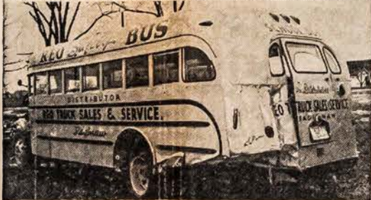
MOKYKLOS AUTOBUSAS STIPRIAI ATSLAIKĖ

CARO, MICH. — Pasažierinis automobilis, greitai važiuodamas pataikė, į 48 pasažierių mokyklos autobusą. Automobilio vairuotojas buvo išmestas, bet pats automobilis palinko po autobusu. Paveikslas rodo, kaip smarkiai automobilis sugadintas ir kiek mažai Reo išdirbystės autobusus sugadintas.