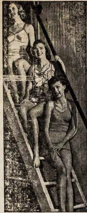
JOS PLAUKIA, TAIPGI Šios panelės įrodys kaip jos moka plaukti laike saugumo perstatymo, Amerikos Raudono Kryžiaus 1948 m. seime, San Francisco, birželio 21 - 24.

rai, ir tuomi, lietuviškas judėjimas, svarbūs darbai ir gyvybiniai tautos veikalai nukentė. Butų ne iš kelio, kad kurie "vadai" apsikrovę visokiomis pareigoms, kurių neatlieka, o "nesusipranta" kad jiems "persunku", kad visuomenė jų "pasigailėtų" ir sumažintų jų pareigas. Atleisdami tokus bent iš kelių valdybų pareigų, kas išėitų visokeriopon naudoti, ir tiems "pavargusiems" nereikėtų skustis persidurbimu, o lietuviškiems reikalams irgi būtų tas produktiviau. Senai tas visuomenei reikėjo padaryti, bet geriau nors ir vėliau negu niekada.