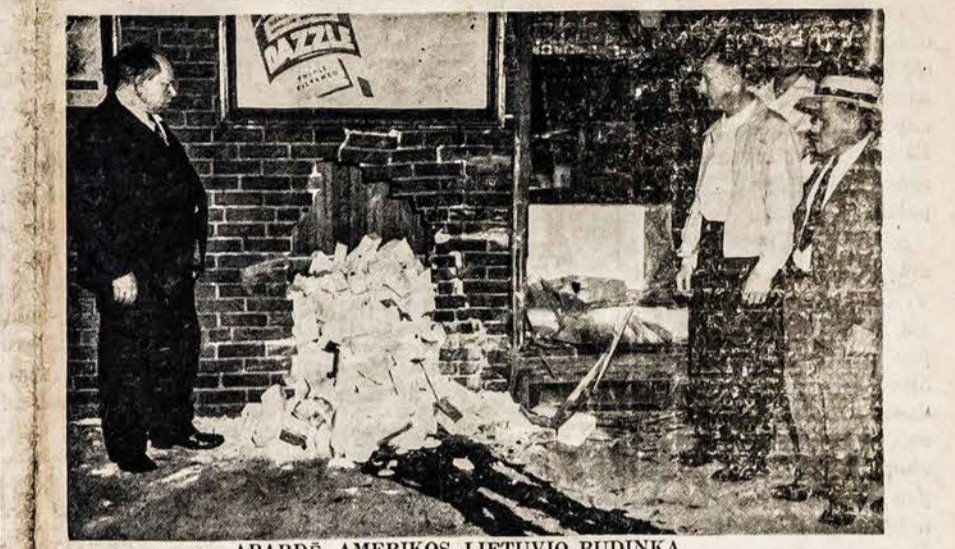
APARDE AMERIKOS LIETUVIO BUDINKĄ

Mažu laiveliu iš Švedijos Anglijon atvyko 29 latviai, nes bijojo, kad švedai juos perduos rusams. Latviai tikisi vykti Kanadon apsigyventi.