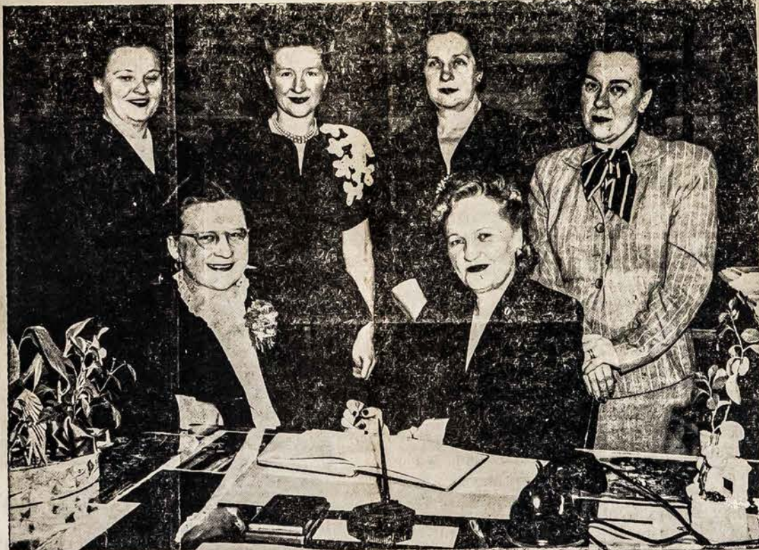
ČIKAGOS LIETUVIŲ MOTERŲ KLIUBAS mini savo 25 metų sukaktį. Tas Lietuvių Moterų Kluabas įsisteigė 1923 metais Čikagoje ir šiais—1948 metais jau švenčia Sidabrinį Jubiliejų.