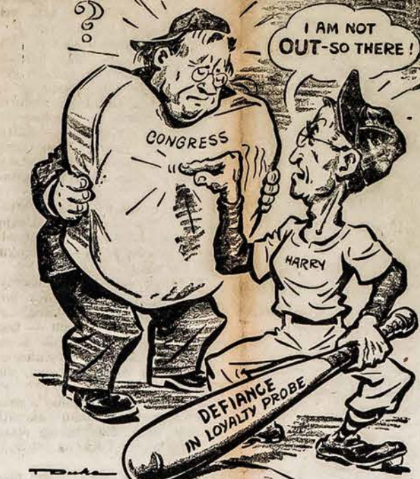
TRUMANAS VISTIEK LAIKOSI SAVO KANDIDATUROS, NORS DEMOKRATŲ PARTIJA JO NELABAI NORI