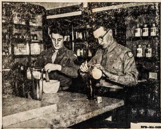
VAISTININKAI Šie vaistininkai technikai dirba moderniškoje gerai įrengtoje vaistinėje, 34-toje Generalinėje Ligoninėje, Korėjoje. Jauni vyrai rodantieji gabumus ir norintieji specializuotis vaistų srityje gali išsilavinti ir gauti patyrimą Šv. Valstijų Armijoje ar Šv. Valstijų Oro Jėgoje.