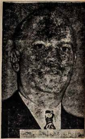
GUB. DWIGHT GREEN

"Netgi, jei jūs studijuojate Rusijos bausmės įstaigas ir jei jūs esate apie tas darbo stovyklas daug girdėję ir skaitę, jūs niekuomet negalėsite pilnai su-