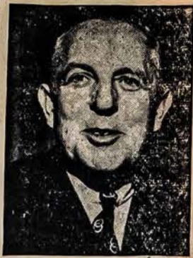
PASKIRTAS ADMINIS. TRATORIUM

Jei anglo-amerikonai būtų galvoję ne širdimis, bet galvomis, tai dabar nebūtų komunistų pavojaus. Karas būtų baigtas ant Dniepro, o ne ant Elbės, komunizmas būtų palikęs Maskvos ribose ir žymiai silpnėjęs psichologiškai ir politiška, militariškai jis būtų nyktukas! Europa būtų sulaukus tvarkos, reformų ir taikos. Bet kai amerikoniškai ir anglai neigdami mažųjų tautų suvereniteto teises pataikavo Maskvos imperia-