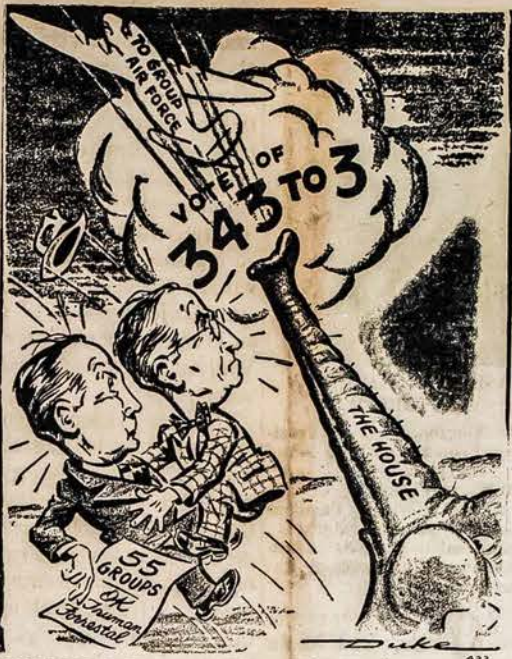
KONGRESAS NUBALSAVO SUSTIPRINTI ORO JĖGAS