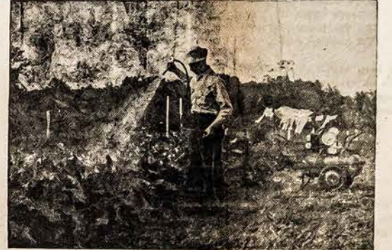
APSAUGOJA DARŽUS NUO MARO LANSING, MICH. — Nauja kilnojama aukšto spaudimo purkštynė, vardu Spartan dabar gaminama John Bean kompanijos. Purkštynė gali būti varoma gasolino ar elektros jėgos ir apipurškia 3 galionus kas minutą, gi jos tankio gali tilpti 15 galionų. Purkštynė gali būti naudojama piktžolių naikinimui, mušiu ir vabzdžių naikinimui, del daržų, vaisių ir kitų medžių.

Washington, D.C., bal. 29. Buto Komitetas del Užsienio Pašalpos viename savo raporte pranešė, kad Sovietų Rusijos biudžetas del "prisiruošimo" karan yra vieną ir pusę kartų daugiau kiek buvo 1940 metais, kaip tik prieš karą su vokiečiais. Taipgi Sovietų Unija gali dabar gaminti daugiau militariškų medžiagų, neg ji galėjo prieš Antrą Pasaulinį karą.