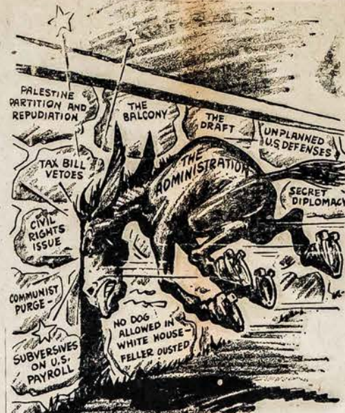
JIS NE AKLAS — JIS TIKTAI NEMATO KUR EINA!

Kažkaip pas Amerikos lietu... vius yra išgyvenęs paprotys, pasivėluot bent geru pusvalan... džiū, ar ir daugiau atein... antį ir susirinkimus. Šitokį pap... rotį turbūt pasisavino ir pats... veikimas. Musų didžioji komisija... jos, kurios pasiėmė iniciatyvą... vadovauti visuomenės mobili... zavimui ir darbą, kažkodėl laiku... ne išdirbo tinkamų planų tin... kamam momentui veikti. Visu... smet naudojasi "antra minti... mi", ir paskui sako, "skundžia... si", kad "jau kiek pavėluota". Taip, mes galime pavėluoti, bet... kalendorius atrodo niekuomet