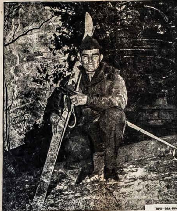
This Regular Army soldier stationed in Korea makes a hobby of cross-country and downhill skiing. Many other qualified young men may find the same spirit of adventure and enjoy the recreational facilities offered by the United States Army and the United States Air Force today.