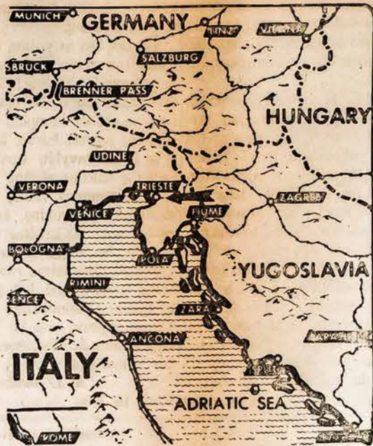
ŠALTAS KARAS DEL TRIESTO

Nors mūsų pinigai, energija ir laikas bėga, kaip pavasary upėmis ledai, kad tik mūsų tremtinius atgabenti į Suvienytas Valstijas, man rodos, kad iš tų miltų menkai bus košės. Lietuvos quata kasmet yra tik 386, o į ją įeina ir žydai. Tokiu būdu imtų 100 metų ištuštinti Europoje. Atsižvelgiant į męginimą gauti tremtinius specialų Kongreso leidimą jiems į Ameriką atvykti, nėra jokios vilties, nors politikieriai nuolat savo naudai duoda visokeriopas pažadėjimus. Emė Kongresui daug metų kol jie surado sistemą, kuria galima nors šiek tiek atskirti ateivius nebus permąnyta dabar, nes ji veikia geriau, ne kaip budavo pirmiau. Specialų leidimą įleisti tremtiniams ir nenutars, nes tarp tremtinių randasi didelis skaitlis tų nereikalingų niekam pelnų. Juos jokia šalis pasaulyje nenori priimti; nors jie turi didelę įtekme, juos Amerika neįsileis. Velionis mano draugas LaGuardia man sakė, kad žydų niekas nenori priimti. Su kitais tremtiniais būtų daug lengviau, jei nesirastų žy-