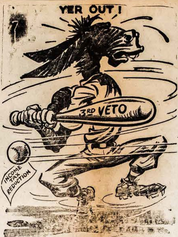
JIS UZBAIGTAS — 3-CIAS VETO!