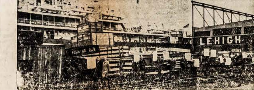
KARO VETERANAI PIKETUOJA PREKES ISVEZAMAS RUSIJON Jersey City. — Čia matome, kaip karo veteranai piketuoja rusų laivą Čukotą, pareiškdami savo vyriausybei protestą prieš išgabenimą mašinerijos ir kitokios medegos Rusijon. Laivas Čukota stovi priplaukoje Lehigh Valley, Jersey City.

ner (prieš tai gyvenęs Ameri- koje ir redagavęs vokišką laik- raštį) ir Zeisser (jo oficialus titulas — Saksonijos policijos viršininkas). Visi kariškio amžiaus vokie- čiai suregistruoti. Jaunuomenė verčiama lankyti "Suvienytos Socialistų Partijos" (komunistų fronte) "sportinio auklėjimo kursas", t.y. kariškiai lavinama ir indoktrinuojama. Buvę kari- ninkai turėjo išpildyti smulkias anketas. Laivyno karininkai ir technikai po to buvo pašaukti "fiziniam lavinimui". Specialius kursus aviacijos veteranams su- rengė Koenigsbrücke, prie Dres- deno, kur ir tankų karininkai toliau apmokomi. Laivyno per- sonalą pasiuntė į Swinemuende, karininkus išsiuntė į Kijeva, Minską, Stetiną ir Charkovą. Tankų karininkus sutelkė Sak- sonijoje. "Sovietiško barbarizmo ir pr- sy karinių tradicijų sudernini- mas ir apmokymas Prūsų Raud- donoje Armijoje tikrai reiškia pavojų civilizacijai, nemenkesnį kaip Hitlerizmas" — baigia pra- nešimą "Plan Talk" korespond- entas.