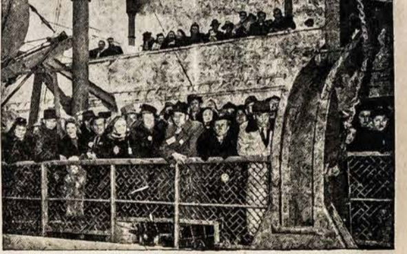
Taip atrodo iš Europos atplaukią su lietuviais laivai. Čia matome S/S Marine Flasher, kuriuo atvyksta daug lietuvių tremtinių j Dėdes Samo žemę. Atvykstančiuosius lietuvius pasitinka BALF ir Lietuvos Konsulato atstovai.