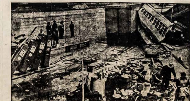
STABDŽIAI NESULAIKE — Brisbane, California. — Didelis 18 ratų sunkvežimis važiuodamas turėjo pralenkti du staigiai sustojančius kely automobilius. Vairuotojas užstojo ant stabdžių, bet jie nelaukė, tai sunkvežimis perėjo kelią į gasolino stotį, sudaužė viską ir sustojo prieš kalną.

Pranešime spaudai apie tą mitingą tarp kitko sakoma: "Prieš kurį laiką dar buvo net bijoma užsiminti apie Baltijos kraštus. Mr. prez. Trumanas tik neseniai viešai juos paminėjo nurodydamas Sovietų užvaldytus kraštus. Valstybės Departamentas po to viešai pareiškė, kad tie kraštai skaitomi nepriklausomais ir JAV niekad nepripažino jų inkorporavimo į SSSR. Pareiškimų jau užtenka. Reikalaujame veiksmų, akcijų."