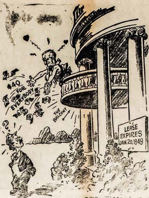
PALAUK! ROMEO—IR TU GAUSI $40.00

LIETUVIAI! SKAITYKITE IR PLAITINKITE AMERIKOS LIETUVI