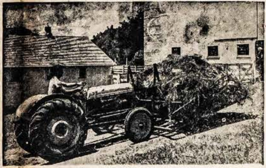
Net ir šiose atomo ir robotinių lėktuvų dienose reikia daryti sieną. Bada ukio darbininkai, labai brangus, ukininkai randa šią modernią mašiną, parankiausią vežimui šieno į tvartą. Mašina pakelia ir nuleidžia sieną po virš ketvirtą dalį tono ant syk.