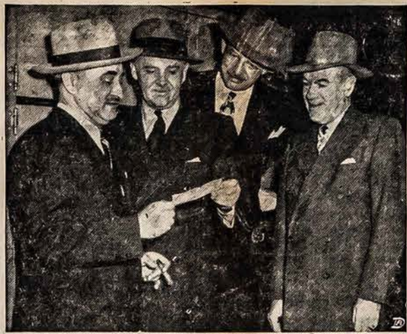
PINIGŲ MASINOS DIDELĖ PAGELBA VEŽIO LIGOS FONDUI