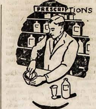
V. Skrensko Vaistinėje Prirengia Vaistus

Žymus lietuvis vaistlininkas Naujoje Anglijoje ir savininkas vienintelės lietuviškos vaistinės Worcester (Ideal Pharmacy, Kelley Sq.) aplankė pereitą sa- vaitę New York'o dideles medi- kaliaskas istaigas. Jo tikslas bu- vo susipažinti su vėliausiom ir naujausiom ka tik išrastom gy- duolėm ir su išradėjais daktarais pasitarti. Jis aplankė Rockefeller Medical Research Center ir gavo vėliausias for- mules del sekančių ligų: 1. Nuo šalčio ir kaulų gėlimo, 2. Del vidurių geresnio virš- kinimo ir stipresnės sveikatos,