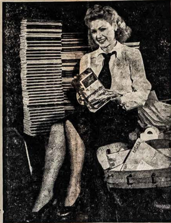
100,000 BROŠIURŲ Neseniai pasiūsta 100,000 brošiurų su informacijomis lietuviams. Gulf Aliejaus kompanija dalina šias brošūras del tų, kurie mėgsta laivininkystę.

Čia lietuvių veikimas yra mažas D. L. K. Gedimino draugija retkarčiais parengia šokus, bet i juos ateina daugiau svetimtaučių, negu lietuvių. Nepasizymėm veikimu ir esanti L.D.L.D. kuopa, kurių nariai susieja pasitarti del palaikymo "Laisvės" ir "Vilnies" laikraščius, kurie tarnauja Suv. Rusijai. B. G. Sitko