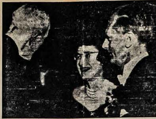
NOBEL DOVANŲ LAIMĖTOJAI

Reikalą pataisė iš kažkur atvykęs mažų ryšulėliu nešinas naujas kalvis. Stambus, petingą kuprą užsiau-