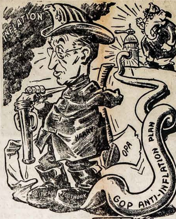
NUMKITE TUOS BATUS!

Valstybė, apart visokių ministerijų, turi ir Švietimo Ministeriją, mes Amerikoj tokią Švietimo Ministeriją turime TEVYNĖS MYLĖ- TOJŲ DRAUGIJOJE. TMD yra pasirengus dar sulost pačią svarbiausią rolę. Tad visi į talką, visi bukite na- riais, visi ugdykite TEVY- NĖS MYLĖTOJŲ DRAU- GIJĄ! Be knygos, be švie- sos, mes ir busime dvasiniai ubagai. J. V. Valickas