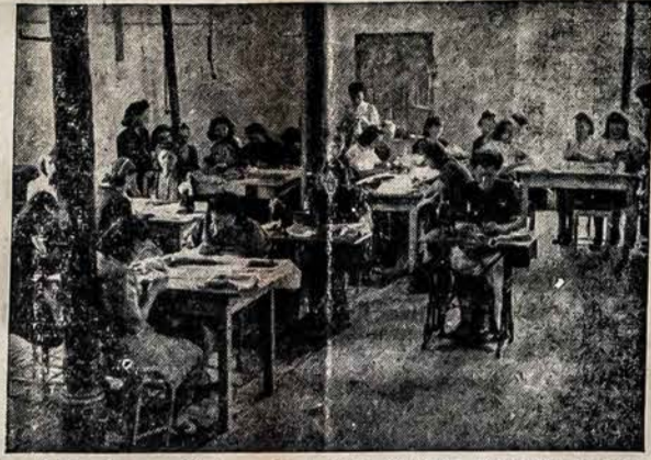
Lietuvės tremtinės mokosi siūti. Vaizdas iš D.P.'s stovyklos, Hanau, Vokietijoje. BALF šelpiti siųskite BALF'ui, 105 Grand Street, Brooklyn 11, N. Y.