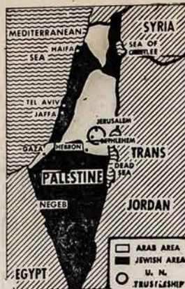
KETINA PADALYT PALESTINĄ

vardus, ir kurie suvilioja žmones prie vientik skurdaus ir vargingo žmoniškumo. Garbingasis žodis laisvė, ir Dieviškasis žodis — meilė, — yra dangiškųjų angelų žodžiai ištartai Šventąją Kalėdų Naktį, visiems geros valios žmonėms. Bet ir tas kilnus žodis, "Geroji Valia," tankiai taip labai nusidėvėjusios moralės dalykuose vartojama, — kad jis suvisu jau nebetenka tos didžiosios palaimos, ir tikrosios savo vertės. Kaip tankiai nieko nepaisantis ir nerupestingas pasaulis, įvairiuose bloguose darbuose, pateisina nieko nebepaisančius savo vaikus, kad, girdi, tai darydami, — "jie nebeturėjo blogos valios!" Taigi dėl to, — mums, tikintiesiems krikščionims katalikams būtina yra reikalinga pažinti ir žinoti, kas tikrumoje yra toji "Geroji Žmogaus Valia?" (Bus daugiau)