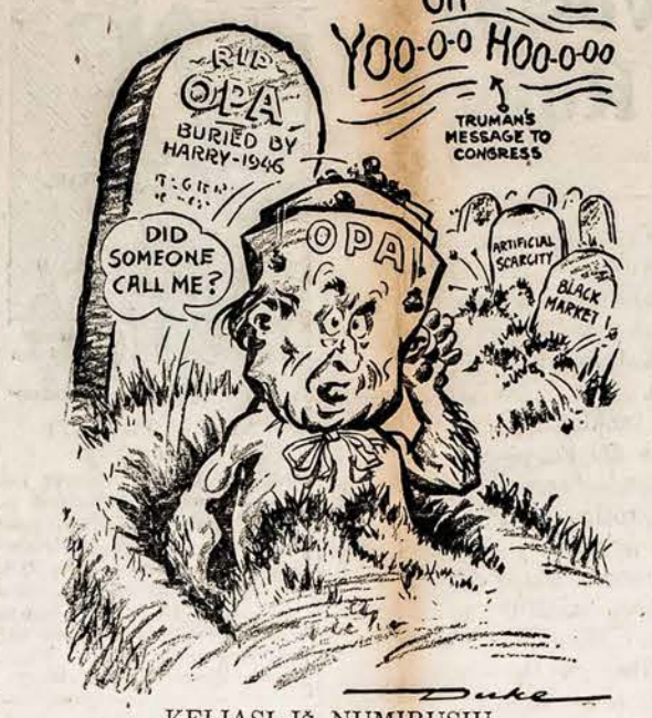
KELIASI IS NUMIRUSIŲ