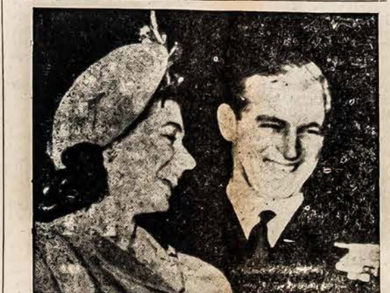
KARALAITĖ JUOKIASI GLASGOU, SKOTIJA. — Karalaitė Elzbieta juokiasi su jos busimu vyru leitenantu Philip Mountbatten, po priėmimo dovanos nuo žmonių gyvenančių Clydebanke.

London, lapk. 20-tą. — Anglijos karalaitė Elzbieta, busimoji įpėdinė į Anglijos sostą ir dabartinis Edinburgo kunigaikštis, Pilypas, susituokė Westminster bažnyčioje, ketvirtadienio ryte. Vestuvėse dalyvavo penki karaliai, aštuonios karalienės ir tarp 2,300 užkviestųjų svečių.