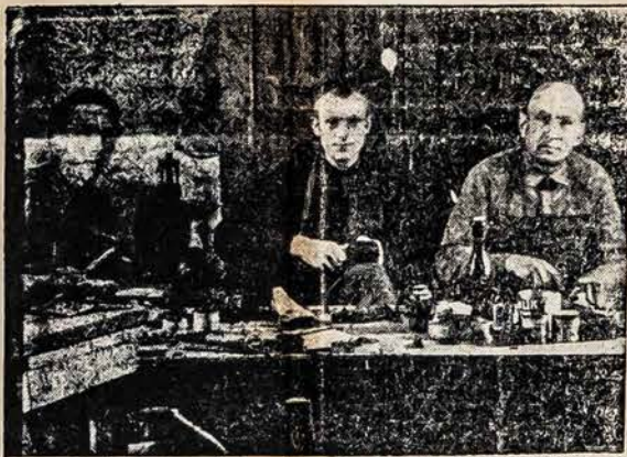
Budinga lietuvių tremtinių stovyklos batusių dirbtuvė ir batusiviai, kurie moka sutaisyti blogesnius Amerikos lietuvių suaukotus batus. Daugiausia reikalingi vyriški batai ir drabužiai. Savo aukas siųskite BAL'ui, 105 Grand St., Brooklyn 11, N.Y.

— Bėgyje 150 metų arba nuo pradžios išdavinėjimo patentų, šioje šalyje išduota 20,000 patentų moterims. — Sakoma, kad didžiausias šios šalies medis, kuris randasi Kalifornijoje, turi 39 pėdas aplink. — Pasak psichologų, moteris labiau myli raudoną spalvą, o vyrai — mėlyną.