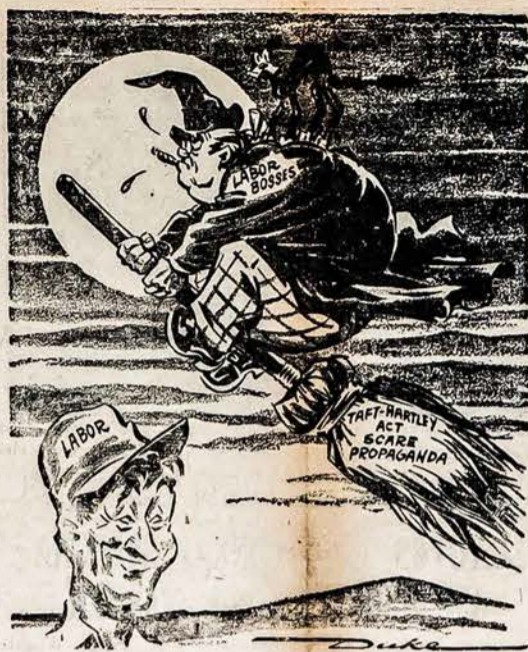
RAGANIUS PAGAUS, JEI NESISAUGOSI!

England. Boston, Mass.—Didžiojo Bostono Sąjungto Zydy Atsisaiki-mo organizacija atidarė $9,100,000 vaju laike puotos Bradford viešbuty. Eddie Cantor, žymus radio ir judomųjų paveikslų artistas buvo svarbiausias kalbėtojas.