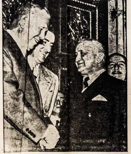
CARP - AMERIKONŲ KONFERENCIJA Rio di Janeiro, Brazil — Valstijos Sekretorius George C. Marshall (laikėje) sveikinasi su Brazilijos prezidentu Eurico Dutra, prieš Tarp-Amerikonų Konferenciją, Petropoly.